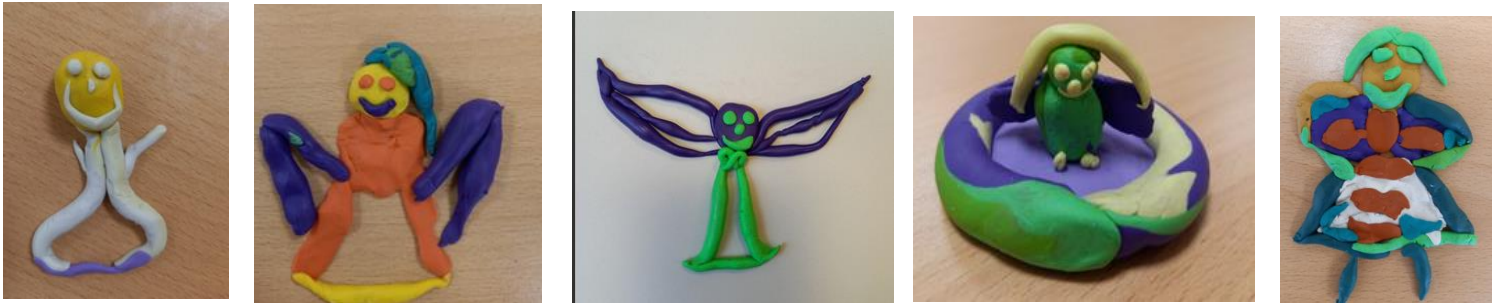
Wir gestalten Engel aus Knete.