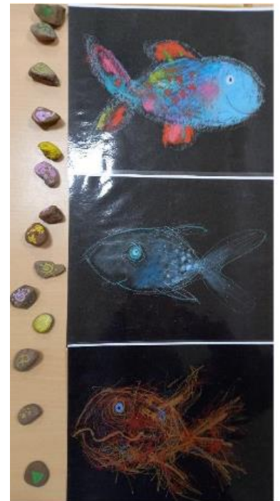
Wir drücken durch Symbole unsere Gefühle aus und versprachlichen sie.

Ich freue mich schon Dich im nächsten Schuljahr im Reli Unterricht zu sehen. Liebe Grüße Frau Gieszer