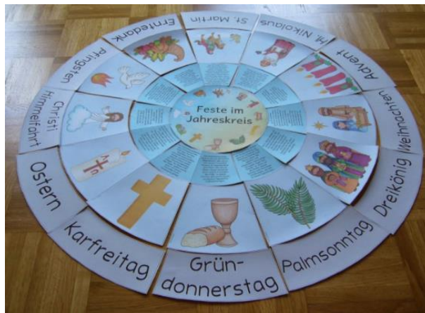
Wir besprechen die christlichen Feste und ordnen sie im Jahreskreis ein.